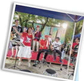
●開催時間／12時～20時30分 ●場所 横川えびす神社ヨコ河岸

ステージは河岸の自然に溶け込んだ環境で様々なジャンルの演奏を聴けます。今年もジプシージャズギターや、ブラジルの都会派伝統音楽「ショーロ」の演奏、ポップでリズムカルなギター・インストゥルメンタル等のアコースティックギターの名手の出演に、様々なジャンルの女性ボーカルの競演、またビートルズナンバーをキーボードとギターのみで奏でるご夫婦ユニット、4月に建国した『横川カンパイ王国』からは間儀&王妃のいくいま、ステージオープニングで盛り上げていただく悪女時代、かりんトリオ、そして女王 I LOVE U@あいのり4組が出演します。日本の夏、横川の夏、ガワフェスで「魂の音楽」を聴いてください！