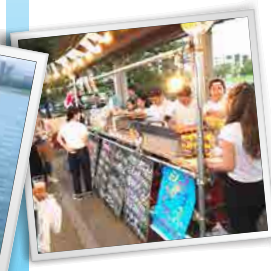
●開催時間／11時～21時まで ●場所／河岸